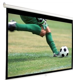
Een groot projectiescherm. Dat is lekker kijken. Ook als er geen voetbal op TV is ...

En nu bent u natuurlijk benieuwd naar die klus in Turkmenistan.... Die zetten we een volgende keer in de spotlights!